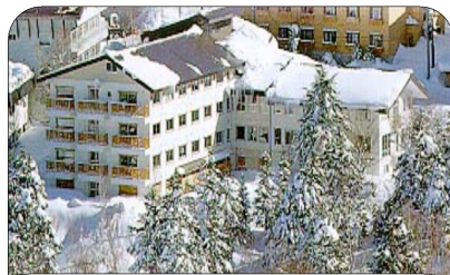
この屋根が、今やブルーシート