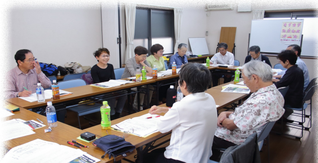
真摯な発言が総会を盛り上げてくれました

また、東山会長はその挨拶の中で、4回目の総会を迎える事ができた事への感謝の気持ちと、今年新たに2名の指導員を誕生させた事についての喜びと中級指導員を誕生させたいという希望を語りました。