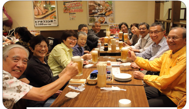
懇親会にあふれる笑顔と飲み物で

→その年、その時の技術レベルを計るテスト。色は技術のレベルに応じて変わる。白は65点以上、青は70点以上という基準がある。