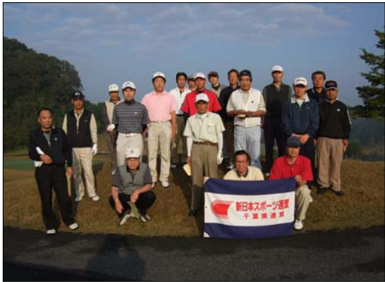
(出発前 倶楽部ハウス前に集合！)

第45回千葉県スポーツ祭典・ゴルフ大会が昨年の10月30日(金)市原市の森永高滝カントリー倶楽部で開催されました。千葉県ゴルフクラブの主催するゴルフ大会としては35回目となる大会で21名が参加しました。