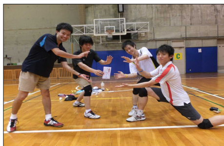
（男子2部 優勝 東京工業大の皆さん）