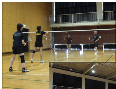
ダブルスの練習（女子）

スポーツ連盟の大会にはクラブの結成当初から参加して楽しませてもらっています。初めて大会に出る人も楽しめるので、これからも楽しい大会を計画してください。