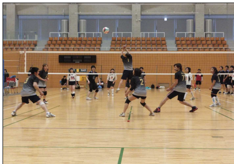
（今年4月のミックスバレーボール大会から）

ミックスバレーボール協議会結成については今年の秋から冬にかけて大会を実施した上で検討することになり、当面松下山公園体育館が12月7日（土）サブアリーナが空いていることから第3回のミックスバレーボール大会を開催することになりました。12チームを募集、交流大会として開催することになりました。