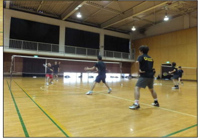
ダブルスの練習（男子）